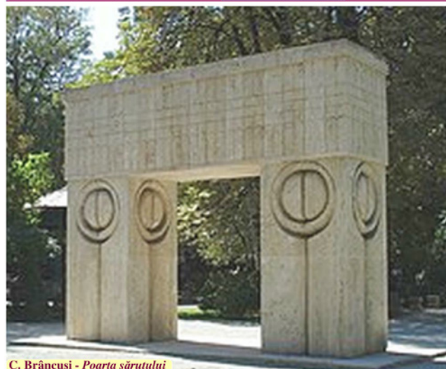
C. Brâncuși - Poarta sârutului